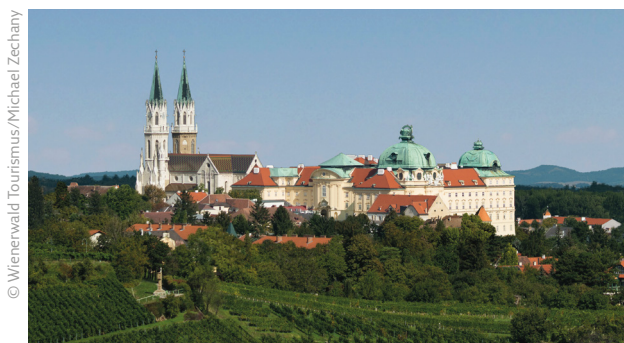
Die Runde geht vorbei an prachtvollen Klöstern – hier Stift Klosterneuburg – romantischen Auen und lichten Wäldern.