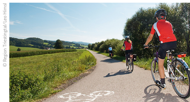
Wenig Steigungen, dafür Radwege abseits vom Autoverkehr.