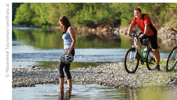
Das Wasser gibt den Weg vor und erfrischt müde Beine – hier am Traisental-Radweg.