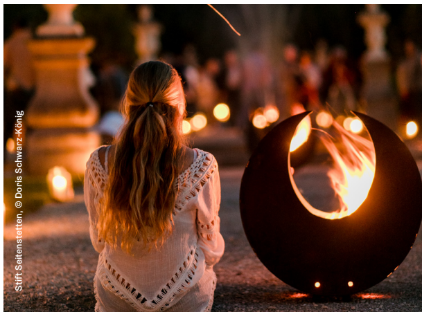
Stift Seitenstetten

Die Gartensommernächte laden zum Abschalten und Genießen ein. Lassen Sie die Seele baumeln!