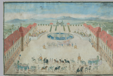
Festzug im Schlosshof 2