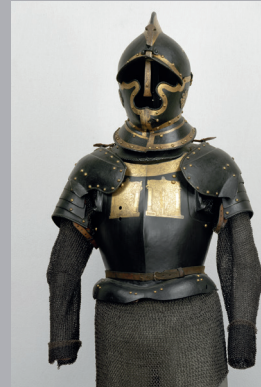
Trabharnisch: Rüstung des Andreas Teufel, Freiherr von Guntersdorf und auf Bockfließ 4