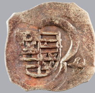
Pfennig aus der Grafschaft Cilli (Münzfund Franzensdorf) 2