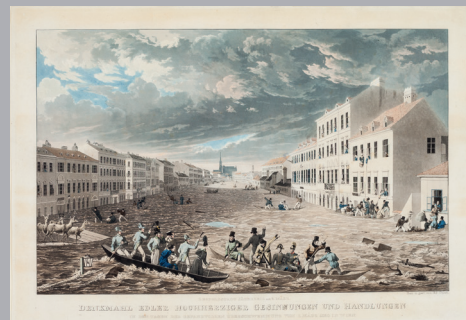
Die Überschwemmung in der Leopoldstadt am 1. März 1830 2