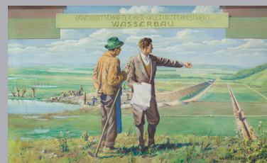
Landwirtschaftlicher (Kulturtechnischer) Wasserbau 2