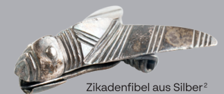
Zikadenfibel aus Silber 2