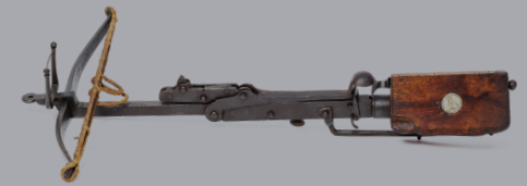
Vogelschnepper: Leichte Armbrust um 1600 2