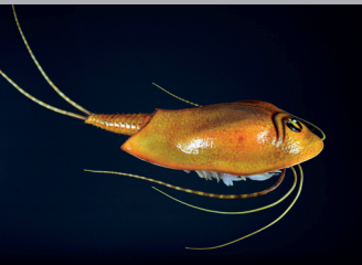
Modell eines Urzeitkrebses 1

— Werfen Sie einen Blick durchs Schlüsselloch auf das spannende Zusammenspiel von Menschen und Natur in dieser beispiellosen Landschaft zwischen Wien und Bratislava.